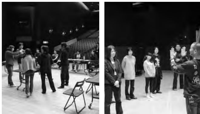
公演に向けての練習風景

演技編、声優編、演出編、照明デザイン編、舞台美術編、女優編、ダンス編のワークショップに参加した受講生が、自ら台本を書き、演技を練習し、舞台セットを考えて「自分が何かしたい!」という気持ちの一つに作り上げた舞台、タイトル『Re:スタート』。