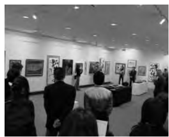
昨年のギャラリートークの様子

会期 2月19日(日)～26日(日) 会場 函館市芸術ホール ギャラリー 時間 午前10時から午後7時 (最終日は午後5時まで) 表彰式 2月19日(日)午前10時 ギャラリートーク 2月19日(日)表彰式終了後 2月22日(水)午後6時15分 入場料 無料 問合せ ☎55-3521 (芸術ホール)