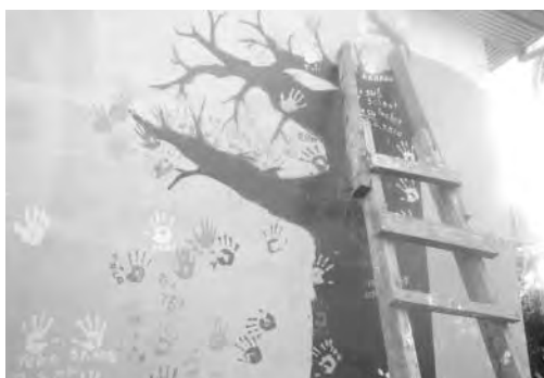
フィジーで生きた証。卒業生の手形で創る、桜のアート

この仕事をやっていて本当に良かったと思う瞬間は、留学中何度かくじけそうになった学生が、卒業式で自信を持った表情で、堂々と英語でスピーチを行う姿を見る時。また、卒業生からの便りで、フィジー留学後に夢を叶えたと報告を受ける時である。特に海外就職を希望して