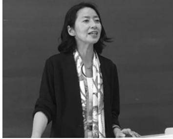
対等な関係を学生とともに考える

私は子どもを中心とした暴力防止のためCAP(子どもへの暴力防止プログラム)や、デートDV出前授業、コンカレントプログラム(DV被害者のための母子同時並行プログラム)などを通じての活動をしています。 DVは「親密な相手からの暴力」と訳せられ、メディアでは命に関わる事件を報道するの