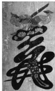
《李朝文字絵(義)》 朝鮮時代(部分)

みなさんが日常的に使う文字や記号をモチーフに、芸術家は、見るひとの想像を広げる新鮮なイメージを生み出します。「義」の一、二画目に二羽の鳥をあしらひ、花を添えた(李朝文字絵(義))は愛らしさたっぷり三島喜美代の(NEWS PA PER F.87)は、くしゃくしゃの新聞紙を巨大な焼き物として表現した作品です。他にも、江戸時代末期の浮世絵やアンディ・ウォーホル(キャンベル・スープII)、平林薫(五十一音一箱)など多彩な作品をご紹介します。