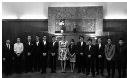
ベルギー王妃とファイナリスト

までおよそ6週間ほどベルギーに滞在しました。3000人を超える応募者から80人ほどが書類・DVD選考によって残り、現地では1次・セミファイナル・ファイナルを競います。このコンクールの特徴は、ファイナルに残ると、1週間一切の電子機器類の持ち込み・外部との連絡が禁止され、森の中にある音楽学校の寮に隔離されることです。この期間で、自分の選んだ協奏曲(オーケストラと共演する曲)の練習のほか、このコンクールの最終関門と言われている、「コンクールのために作曲されたオーケストラとピアノのための新曲を渡され仕上げなければならない。コンクール開始からこのファイナルまでにすでに1か月近くが経っており、体力も精神力も疲れがピークに達しそうな時期にこの最強課題。すごいことを考えたものです。まったく知らない複雑な曲を、与えられた時間でいかに自分のものにし