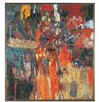
稲岡律子(作品) 1966(昭和41年) 北海道立函館美術館蔵