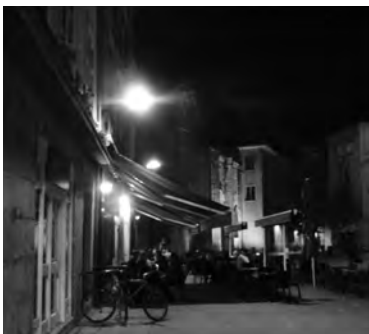
カフェ風景、グルノーブル

行きました。グルノーブルからは列車で2時間程度の場所なので、国境を超えるのにそれほど緊張感を持つていなかった私だったのですが、ジュネーブで広大なレマン湖やその他の自然湖の畔に立ち並ぶ家々や市街のカフェでの賑わいを目の当たりにした私は、フランスとスイスが地続きで日本のように海峡で分断されているわけでもないのに、国境を越えることによって随分とみんなの生活スタイルが変化することに、気が付きました。ところでグルノーブルはローヌ・アルプという地域にある山に囲まれた都市です。アルプスの山麓や、近くにはイタリアの国境もあります。現在、自らの研究の要となるフランス語の運用法を学びにグルノーブルへ来ている私ですが、しばしば山の向こう側にある外国各地に、思いを募らせてみます。今秋、街中のカフェで飲み物を頼み身体を温めながら周りを見渡してみると、古い教会や民家の他に、遠くには秋の山脈が見え、私は日々、山にある国と国との境目の光景を想像してしまいます。私は、都市の姿と国境に絶えず意識を向けて過ごしているのです。 話は変わって、グルノーブルにおける季節の流れはちょうど北海道に似ています。10月でサマータイムも終わり、すっかり秋の季節です。冬も、もうすぐそこ。空気は寒く、冷たい風が吹くこの頃です。