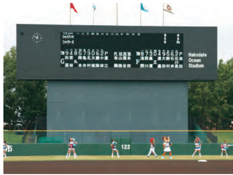
一新されたスコアボード

リニューアル後プロの試合が行われるのは初めて。新設されたフルカラーLED使用のスコアボードに流れる迫力ある映像や球速表示に場内がどよめく場面もありました。また、9日の巨人戦では、始球式に道内唯一の国宝である中空土偶の着ぐるみ「茅空（かつくう）」が登場するなど、北海道・北東北の縄文遺跡群の世界遺産登録を記念したイベントも実施され市民の注目を浴びました。市民にプロ選手の一流の技術を間近で見てもらいたいと誘致を進めてきた函館市教育