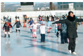
スケート教室の様子