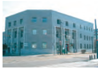
北方民族資料館 ☎22-4128/末広町21-7