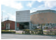
北洋資料館 ☎55-3455/五稜郭町37-8