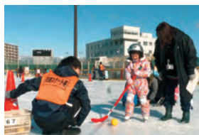
イベントデーの様子