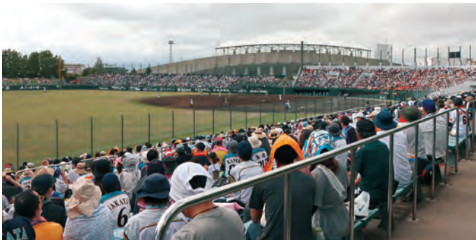
新しい観戦スタイルで静かに見る観客

リニューアル後プロの試合が行われるのは初めて。新設されたフルカラーLED使用のスコアボードに流れる迫力ある映像や球速表示に場内がどよめく場面もありました。また、9日の巨人戦では、始球式に道内唯一の国宝である中空土偶の着ぐるみ「茅空（かつくう）」が登場するなど、北海道・北東北の縄文遺跡群の世界遺産登録を記念したイベントも実施され市民の注目を浴びました。市民にプロ選手の一流の技術を間近で見てもらいたいと誘致を進めてきた函館市教育