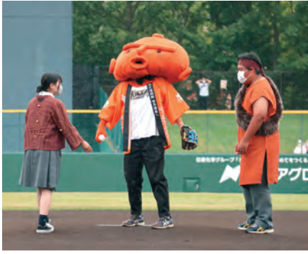
始球式に登場した中空土偶「茅空」の着ぐるみ

東京オリンピックに伴うプロ野球公式戦中断中に開催された「2021プロ野球エキシビジョンマッチ」。オーシャンスタジアム（千代台公園野球場）では北海道日本ハムファイターズが8月4日から9日まで計5試合（対横浜DeNAベイスターズ3試合、対読売ジャイアンツ2試合）を行い、スタンドは試合を待ちわびたファンの熱気に包まれました。函館でのファイターズ主催試合は2017年以来4年ぶり。同球場は、令和元年から令和2年3月にかけて内野グラウンドの表層土の入れ替えや観客席の交換をはじめとする大規模改修を行っており、