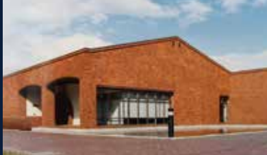
1982(昭和57)年9月開館当時