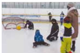
イベントデーの様子