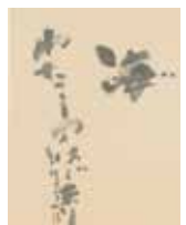
中野北溟(海原修詩) 2005年 羽幌町立中央公民館 (書の北溟記念室)蔵