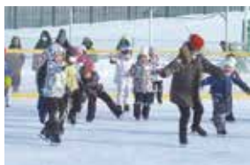
スケート教室の様子