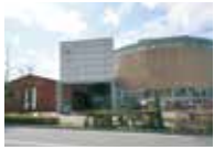
北洋資料館 ☎55-3455/五稜郭町37-8