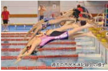
過去の市民水泳記録会の様子

公式大会さながらの環境で勝敗、順位にこだわらず、気軽に参加できる記録会です。自身の記録を知り、より水泳に親しみをもっていただくことを目的としています。