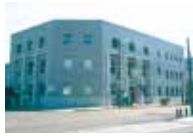
北方民族資料館 ☎22-4128/末広町21-7