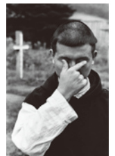
奈良原一高(王国)より(沈黙の國) 1958年 北海道立函館美術館蔵 ©NARAHARA IKKO ARCHIVES