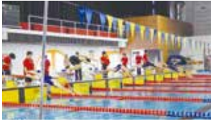
市民水泳記録会の様子

勝敗や順位に関係なく、自己のタイムを知り、より一層水泳に親しみを持っていただくことを目的としたイベントです。