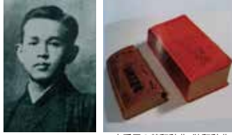
啄木愛用の英和辞典、独和辞典 『新潮日本文学アルバム』より

啄木自筆の短歌「秋草」等が掲載されている中学校時代の回覧雑誌『爾藝多麻(にぎたま)』や、啄木自らが整理して自筆メモも記されているスクラップノート、愛用の辞書などを紹介します。また、妻節子の手による、啄木が息を引き取った翌日の明治45年4月14日までの「金銭出納簿」など、「啄木文庫」に大切に所蔵されてきた遺品の品々を展示します。