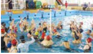
市民プールまつりの様子

通常使用できない遊具を用いた水中ゲーム大会や、プールの終日無料開放を予定しています。