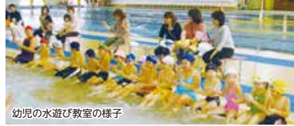
幼児の水遊び教室の様子

4月にスタートする各種水泳教室の受講者を募集します。50mプール棟の天井改修工事のため休止していた「市民水泳50教室」や「幼児の水遊び教室」も再開いたします。教室により受付開始や実施期間などが異なりますので、詳細はホームページをご覧ください。直接市民プールまでお問合せください。